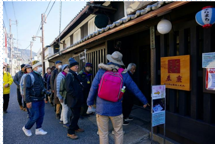
春鹿酒蔵到着 さあ試飲だよ!