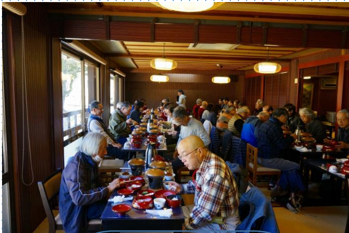
吉野くず膳頂きました