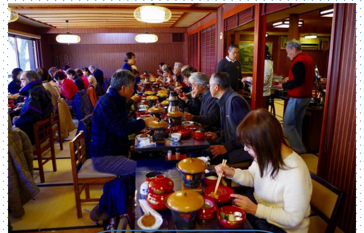
吉野くず膳頂きました